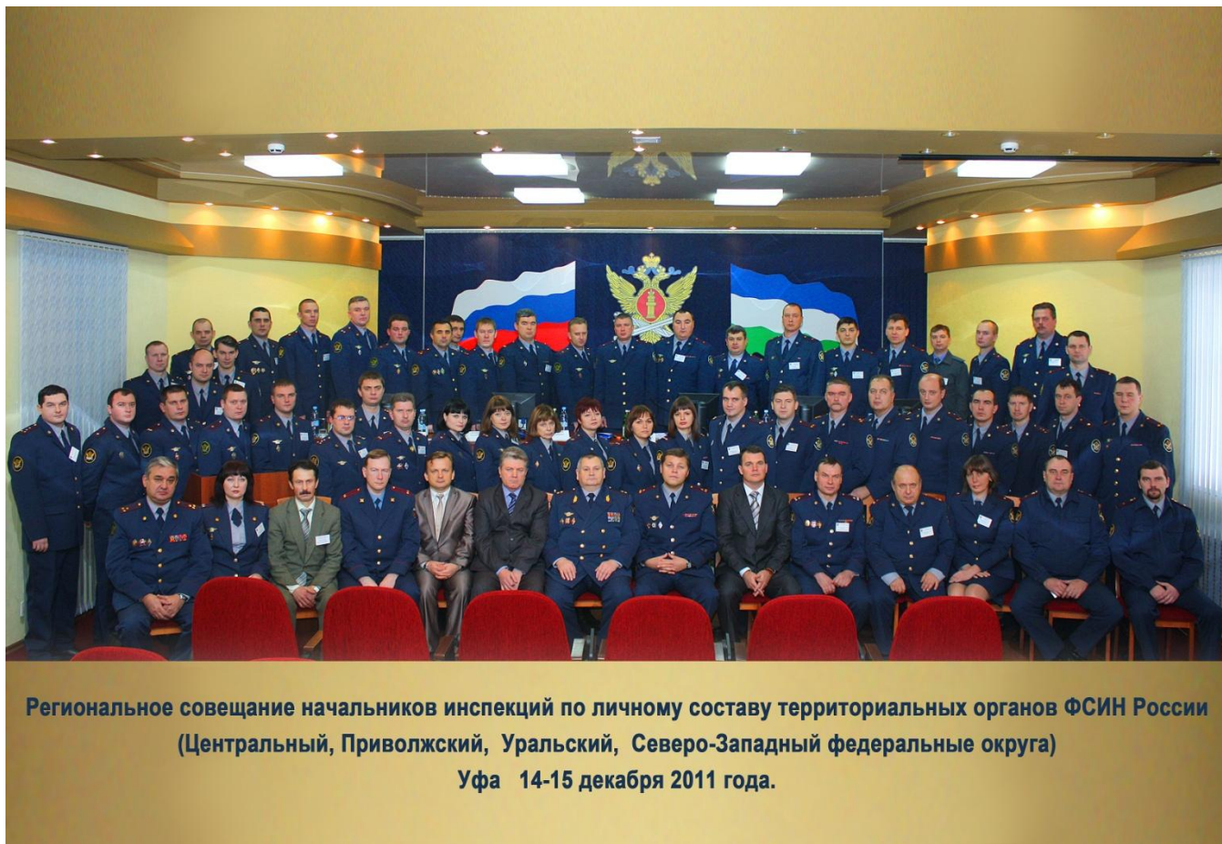
Региональное совещание начальников инспекций по личному составу территориальных органов ФСИН России (Центральный, Приволжский, Уральский, Северо-Западный федеральные округа) Уфа 14-15 декабря 2011 года.

и преступлений, совершаемых сотрудниками УИС, поставлены задачи по организации взаимодействия с подразделениями собственной безопасности территориальных органов ФСИН России в рамках противодействия коррупции в учреждениях и органах УИС с учетом положений Концепции развития УИС до 2020 года.