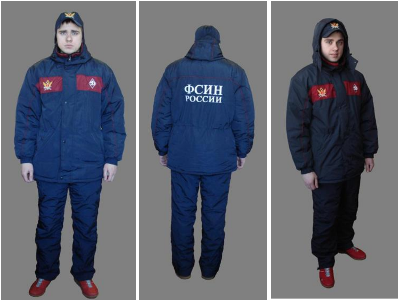
Спортивная форма одежды (зимний вариант): - костюм спортивный зимний, - бейсболка утепленная.