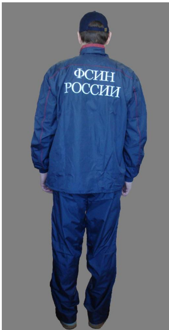
Спортивная форма одежды (летний вариант): - костюм спортивный летний, - бейсболка летняя.