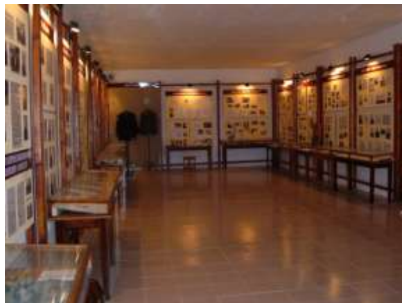
Экспозиция музея истории УИС ГУФСИН России по Приморскому краю (3 место в 2009 году)