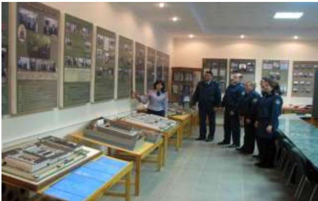
Экскурсия в музее истории УИС УФСИН России по Курской области (1 место в 2009 году)

в 2009 году музеи истории УИС ГУФСИН, УФСИН России по Красноярскому Приморскому краям Курской области, ИК-25 УФСИН России по Волгоградской области, ИК-2 УФСИН России по Республике Татарстан, ЛИУ-3 УФСИН России по Новгородской области.