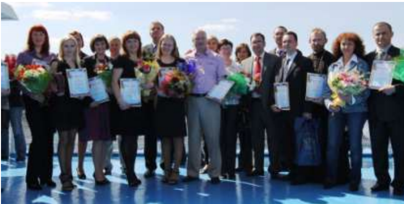
Лауреаты Пятого конкурса «На страже порядка» (2011 г)

Регулярно выпускаются репортажи и публикации в СМИ, объективно отражающие деятельность УИС, смелые и решительные действия сотрудников. Ежегодно за высокое профессиональное мастерство по итогам смотра-конкурса на лучшую журналистскую работу о деятельности уголовно-исполнительной системы «На страже порядка» производится награждение журналистов центральных и региональных СМИ в различных номинациях.