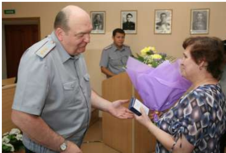
Награждение представителей актива ветеранской организации УФСИН России по Тюменской области

В 2009 году новым импульсом в развитии ветеранского движения стало распоряжение ФСИН России от 26.10.2009 № 309, в котором ветеранские организации призваны повысить свою роль в проведении наставничества, повышении профессионального мастерства молодых сотрудников. В программу каждого выезда директора ФСИН России в территориальные органы обязательно входит встреча с ветеранским активом, на которой доводятся задачи реформирования, роль и место ветеранов в этой работе, разрешаются проблемные вопросы, награждаются наиболее заслуженные ветераны.