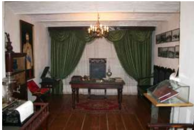
Элемент экспозиции музея истории УИС ГУФСИН России по Красноярскому краю (2 место в 2009 году)