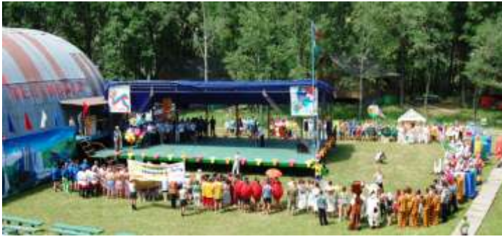
Открытие ежегодного фестиваля сотрудников УИС Самарской области

Итоги культурно-досуговой работы, изучение практики организации досуга сотрудников и членов их семей отражены в сборнике «Инновационные формы и методы культурно-досуговой работы в учреждениях и органах УИС».