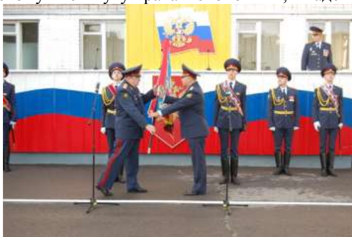
Вручение директором ФСИН России А.А. Реймером знамени Вологодскому институту права и экономики ФСИН России

На сегодняшний день организованы и проведены торжественные мероприятия по прибавке и вручению знамени 8 территориальным органам и образовательным учреждениям: ГУФСИН, УФСИН России по Республике Коми, Красноярскому и Приморскому краям, Курганской, Оренбургской, Тверской областям, Вологодскому институту права и экономики, Академии ФСИН России.